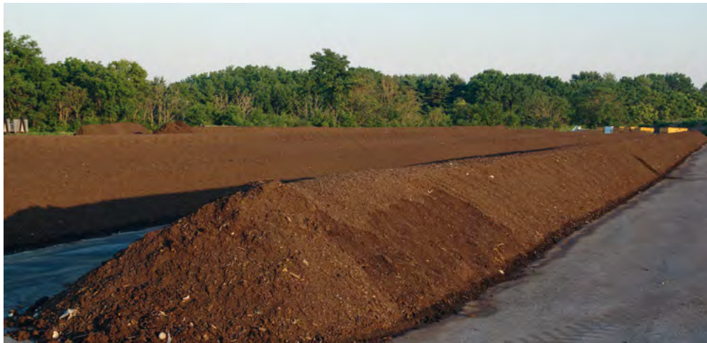
Sogenannte Mieten oder Haufwerke.

Im mittleren Teil dieser Broschüre finden Sie eine Liste der Stoffe (Trennliste), die über die Biotonne im Landkreis München gesammelt werden sollen. Daneben finden sich die Stoffe, die nichts in einer Bioabfalltonne zu suchen haben – und zwar aus guten Gründen.