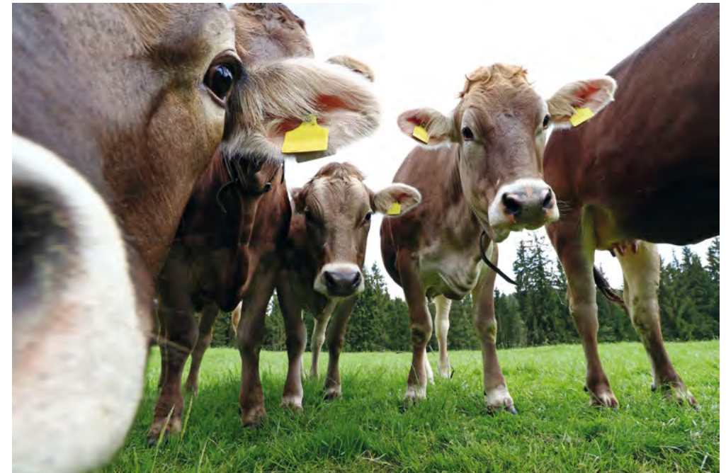
Salopp gesagt: eine Biovergärungsanlage ist auch nur eine Kuh.

Das Bild mit der Kuh ist auch insofern hilfreich, weil alles, was eine Kuh nicht frisst, wie zum Beispiel Holz, Eierschalen, Nussschalen oder Marmeladengläser, auch in der Vergärungsanlage nicht verwertbar ist. Diese nicht verwertbaren Stoffe müssen als Abfall ausgeschleust werden. Dabei entstehen nicht unerhebliche Kosten, die bei richtiger Entsorgung vermieden werden können.