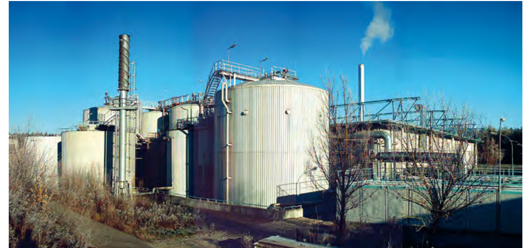
Die Biovergärungsanlage in Brunnthal-Kirchstockach.