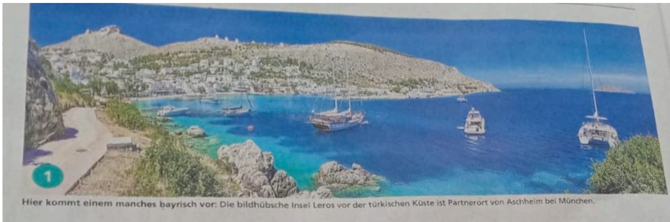
Hier kommt einem manches bayrisch vor: Die bildhübsche Insel Leros vor der türkischen Küste ist Partnerort von Aschheim bei München.