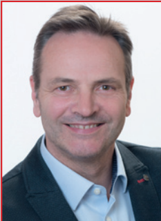
Robert Ertl 2. Bürgermeister